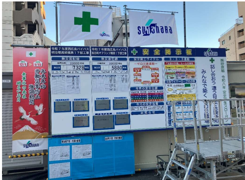
安全掲示板設置状況